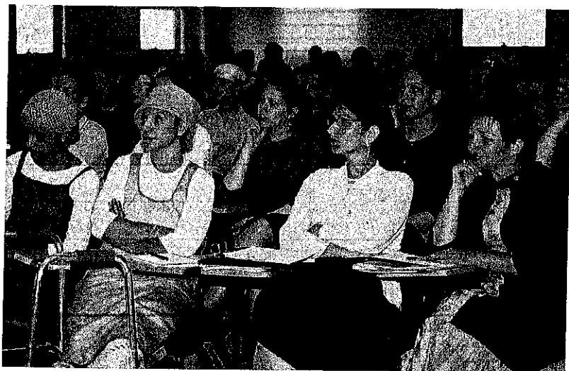
12 נשים חרדיות לומדות במכללת אונגו. פחות מ-15% מנשים חרדיות בין הגילאים 25 עד 40 הן בעלות תארים אקדמיים

בעבר הלא רחוק, תמותת תינוקות וילדים היתה גבוהה בכל מקום בעולם, ובפרט בארץ ישראל. הביטחון הפיזי של יהודים ולא יהודים שחיו בה היה תמיד רופף. ואז עם ישראל עבר שואה נוראית. אלה היו ימים ש"פרו ורבו" היתה אסטרטגיה לאומית ואישית מוצדקת. אך ימים אלו שייכים לעבר, ולא ישובו עוד. כדי להציע מחר לצאצאיו של ישראל סיכוי לחיות היטב ולא רק לשרוד, יש לייצב את האוכלוסייה כבר כיום. משמעות הדבר היא הפנמת הברכה הגדולה ביותר של העידן המודרני: ההזדמנות לקדש את איכות החיים, ולא דווקא את כמותם.